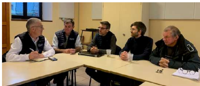
Rencontre avec le Conseil départemental

**Fonjep : Fonds de coopération de la jeunesse et de l'éducation populaire