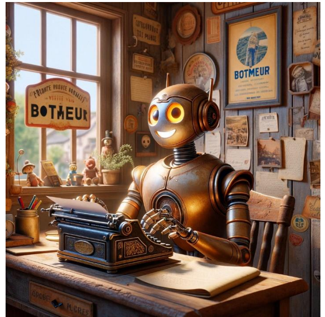
Image créée avec ChatGPT 4 associé à DALLE.E

Si vous avez besoin de voyager fréquemment ou si vous préférez la proximité d'un aéroport international, l'éloignement géographique de Botmeur peut être un inconvénient. En fin de compte, le choix de s'installer à Botmeur dépend largement des préférences personnelles, des priorités individuelles et du style de vie recherché. Ce qui pourrait être perçu comme un inconvénient pour une personne pourrait être exactement ce qu'une autre recherche dans un lieu de vie".